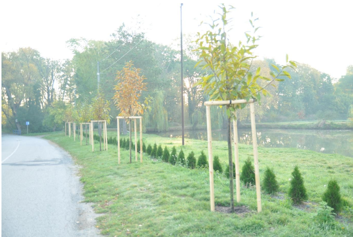
Zážitková zóna „Rybníček“