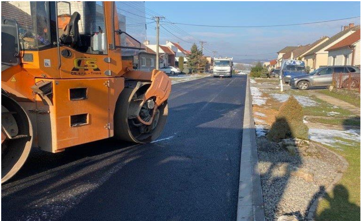
Budovanie MK – Kátlovce časť obce Lipina