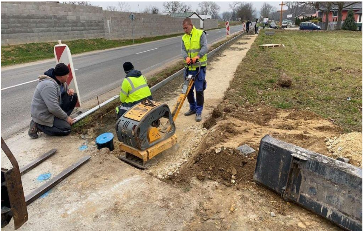
Budovanie chodníka Horná ulica