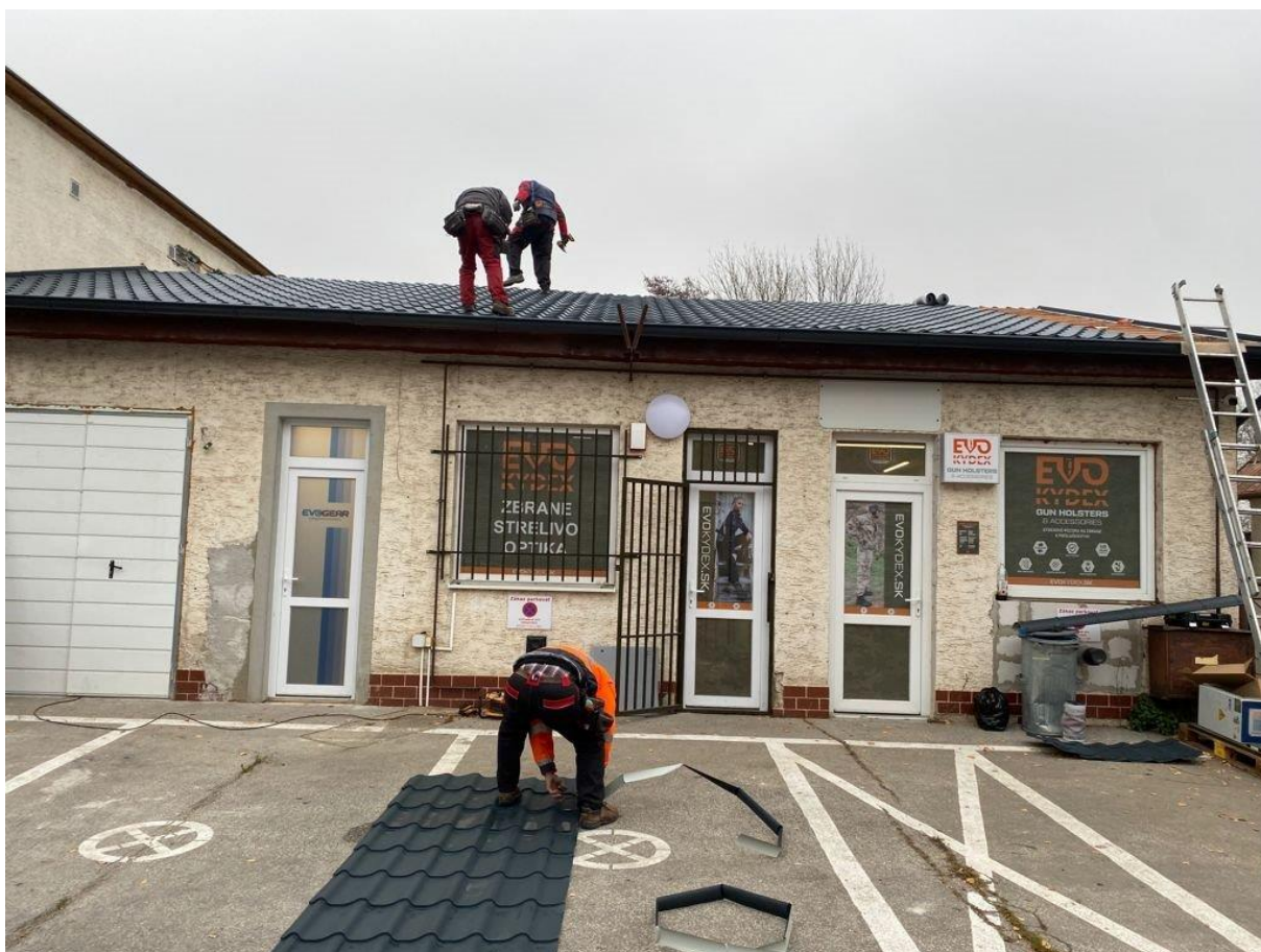
Rekonštrukcia strechy na Dome služieb