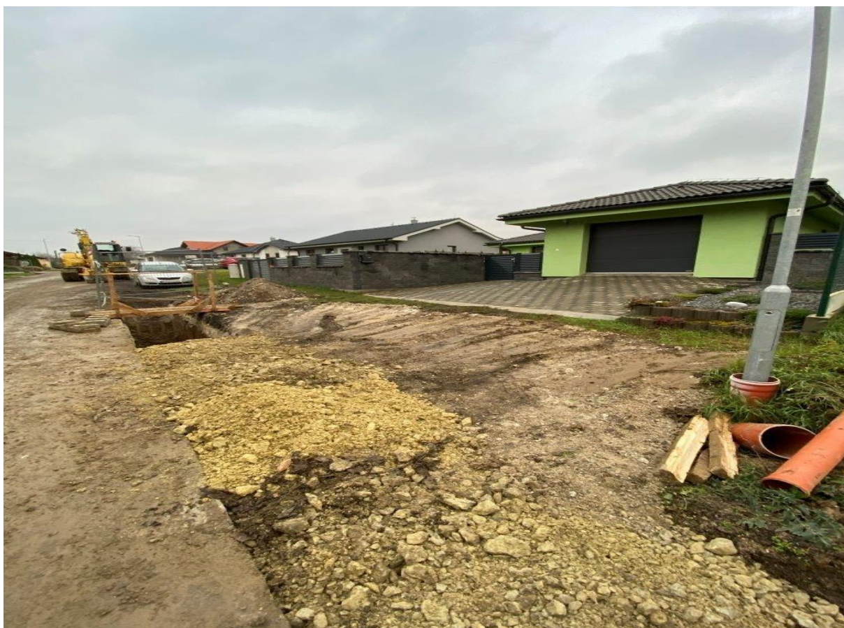
Kátlovce - IBV (voda + kanalizácia)