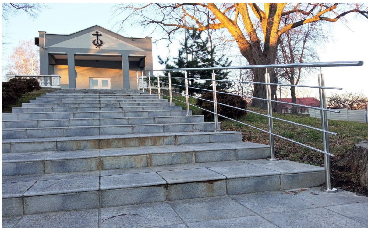
Nové zábradlie pri Dome smútku