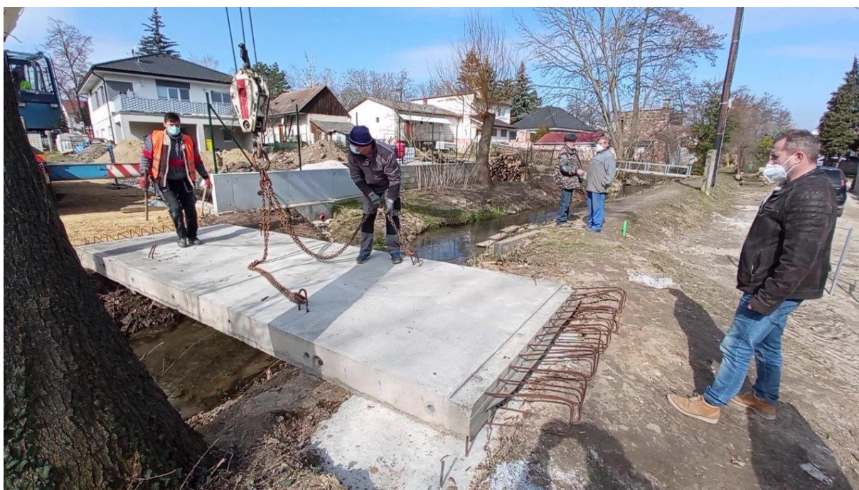
Výbudovanie lávky cez potok Blava