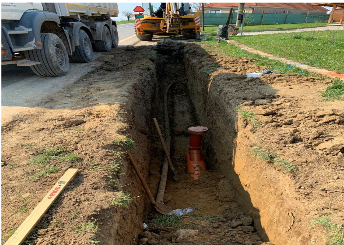
Vybudovanie kanalizácie - Dolný koniec